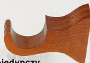
uchwyt pojedynczy 10,3 cm (SRO)