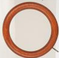
uchwyt pojedynczy 28 cm (SXXRO)